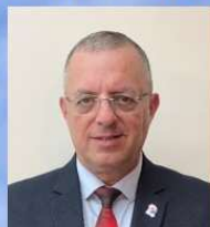
הנגיד בשיר נוסיר