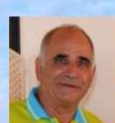
עמוס ון ראלטה