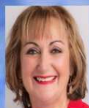
יועצים לנגיד מלי לוי