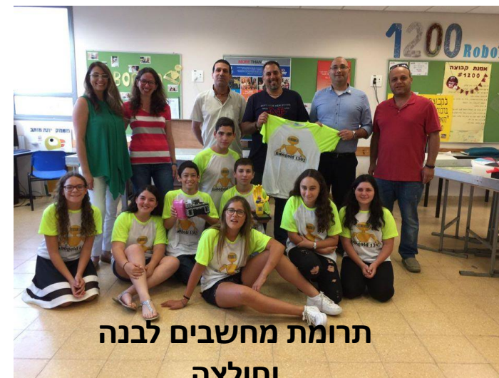
תרומת מחשבים לבנה וחולצה