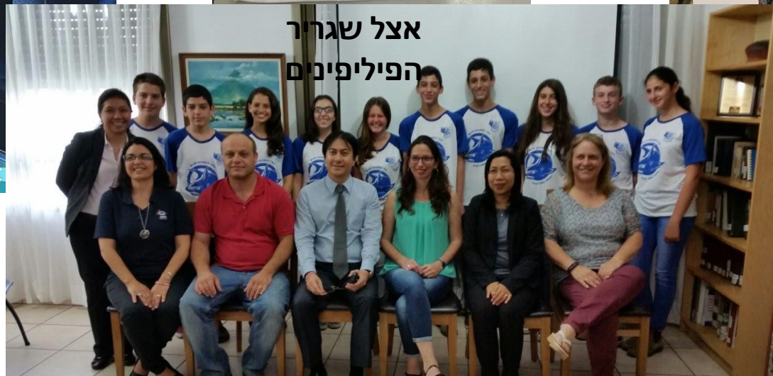
אצל שגרור הפיליפינים